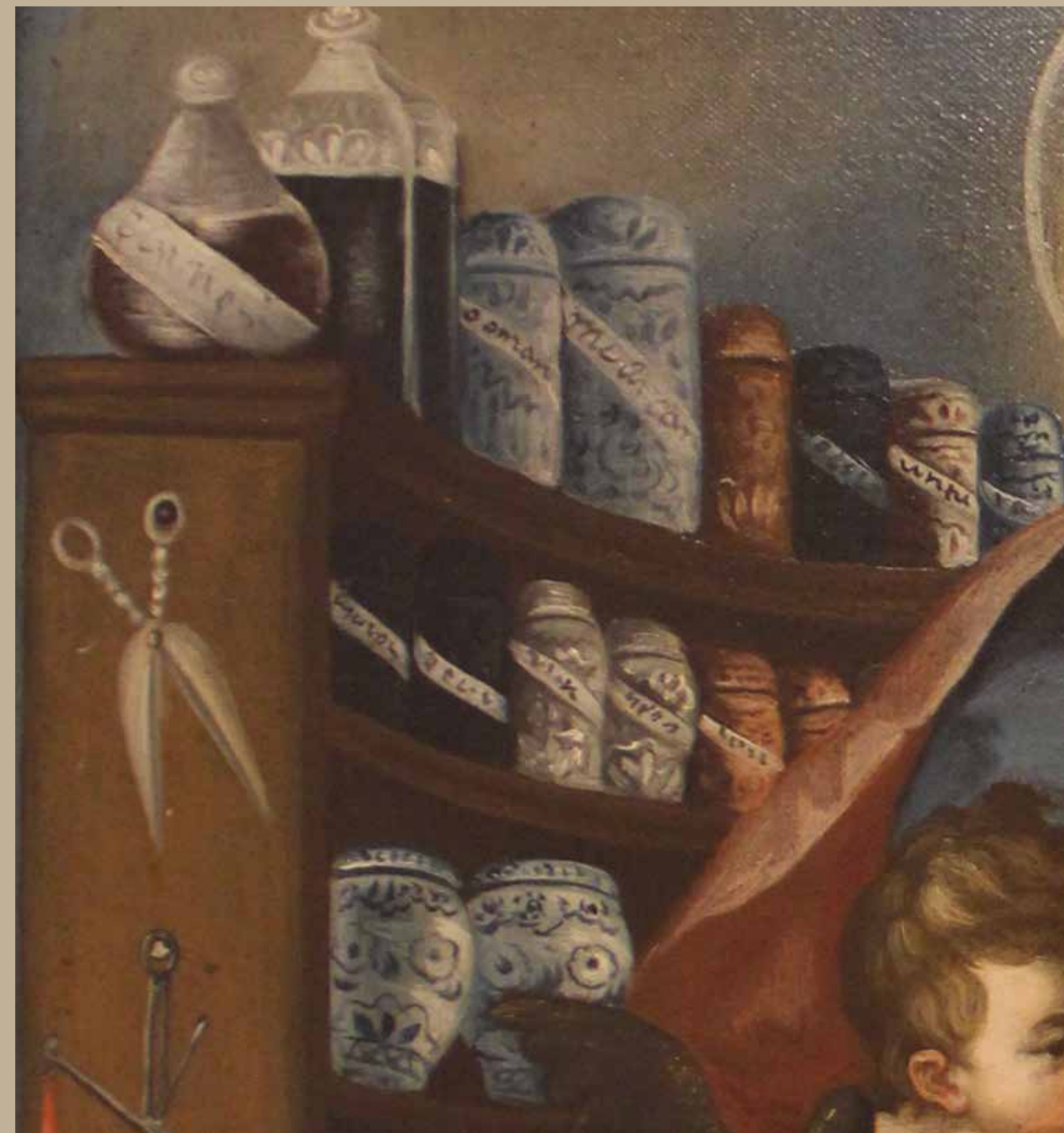
Detalles del cuadro San Lucas Taller de Bernardo Rodríguez de la Parra, Siglo XVIII Óleo sobre lienzo / Colección Museo del Carmen Alto

Esta obra constituye una de esas escasas alusiones a San Lucas como médico en el arte, lo cual se explica dado que el lienzo y la serie a la que corresponde, fueron realizados en base a unos grabados alemanes.