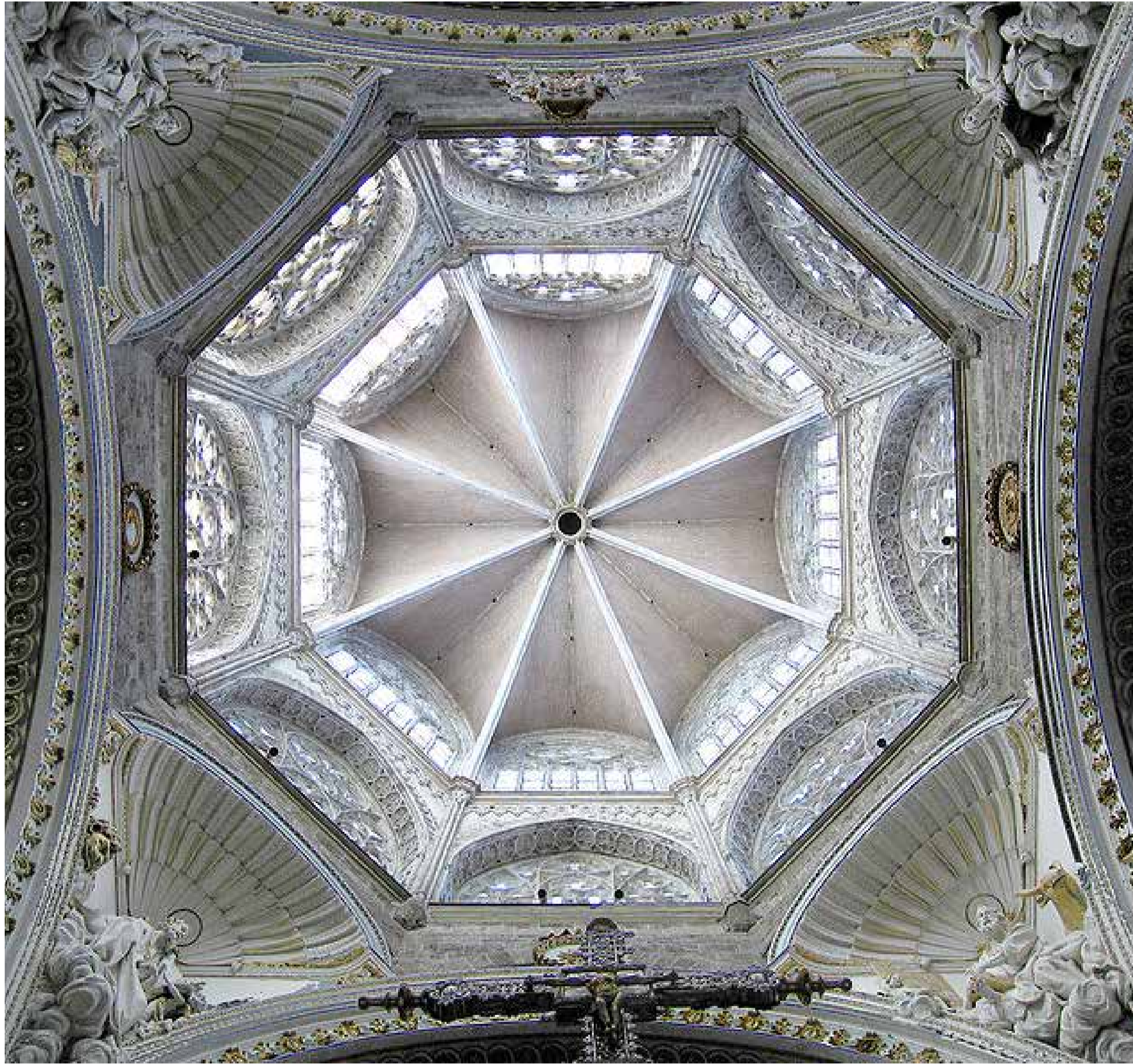
Catedral del Santo Cáliz. Valencia-España

Lucas, junto a los otros tres evangelistas aparece frecuentemente en la decoración de las iglesias, ocupando los lunetos o pechinas bajo la cúpula.