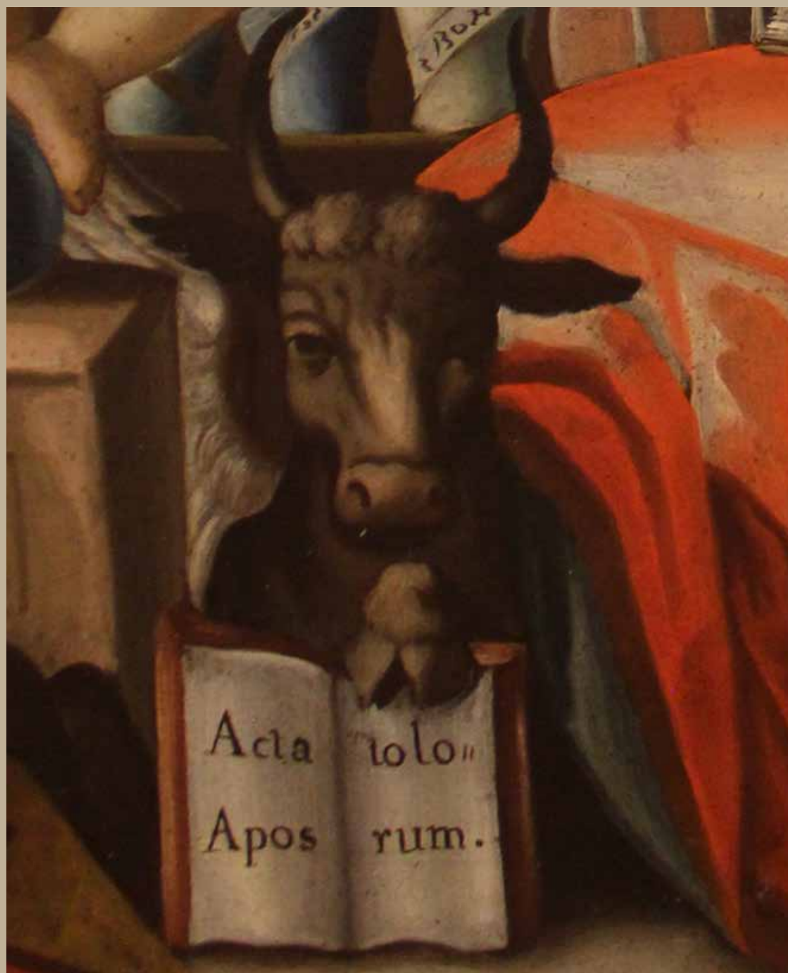
Detalles del cuadro San Lucas Taller de Bernardo Rodríguez de la Parra, Siglo XVIII Óleo sobre lienzo / Colección Museo del Carmen Alto

contrarreforma. La representación más frecuente es San Lucas en actitud de escribir su Evangelio, junto a un tintero, una pluma y un libro.