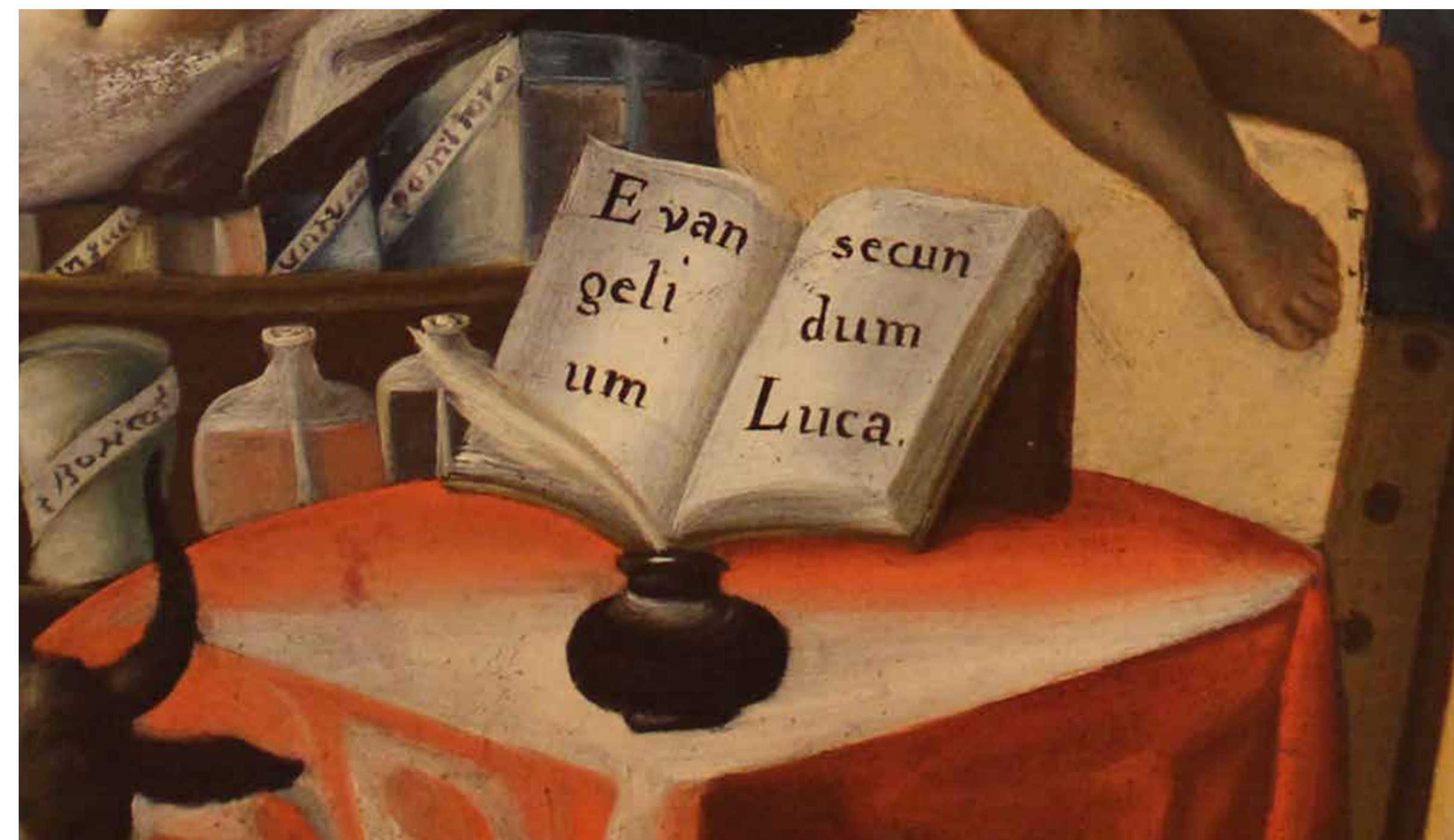
Detalles del cuadro San Lucas Taller de Bernardo Rodríguez de la Parra, Siglo XVIII Óleo sobre lienzo / Colección Museo del Carmen Alto

contrarreforma. La representación más frecuente es San Lucas en actitud de escribir su Evangelio, junto a un tintero, una pluma y un libro.